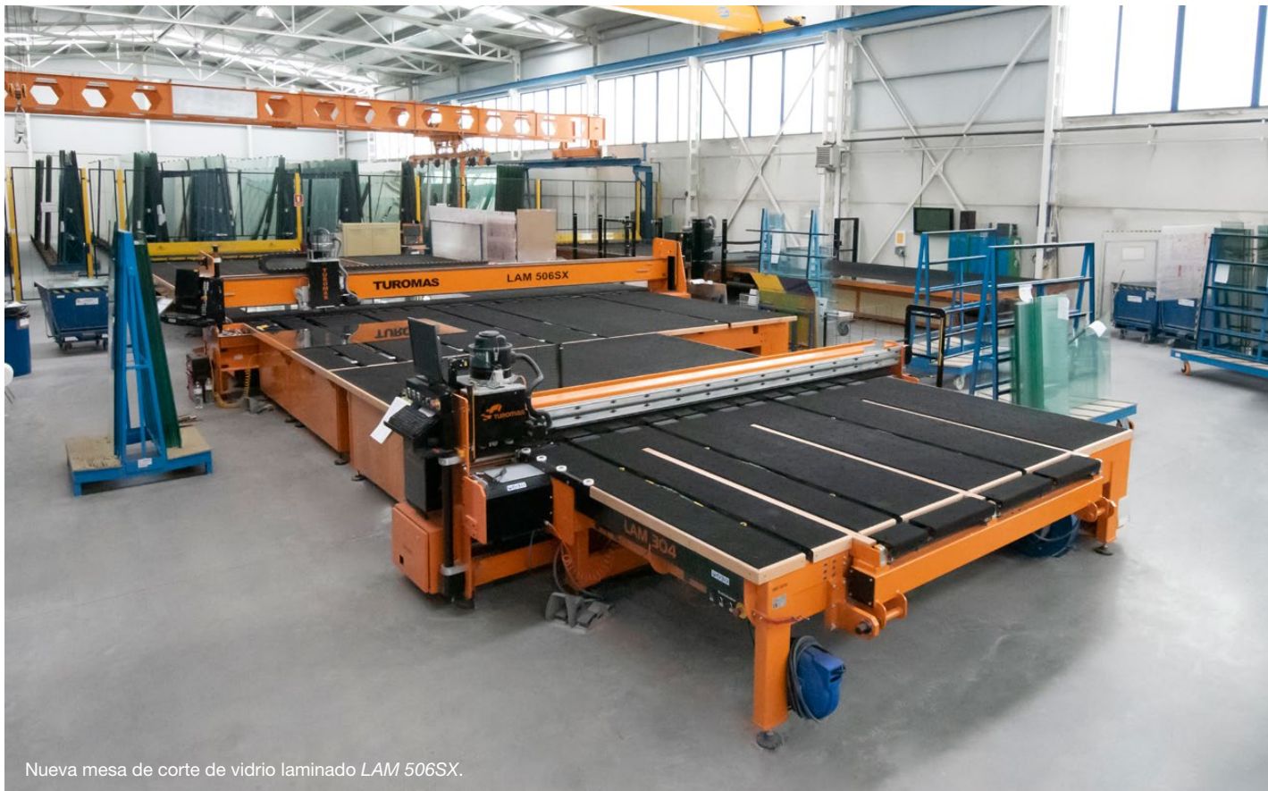
Nueva mesa de corte de vidrio laminado LAM 506SX.