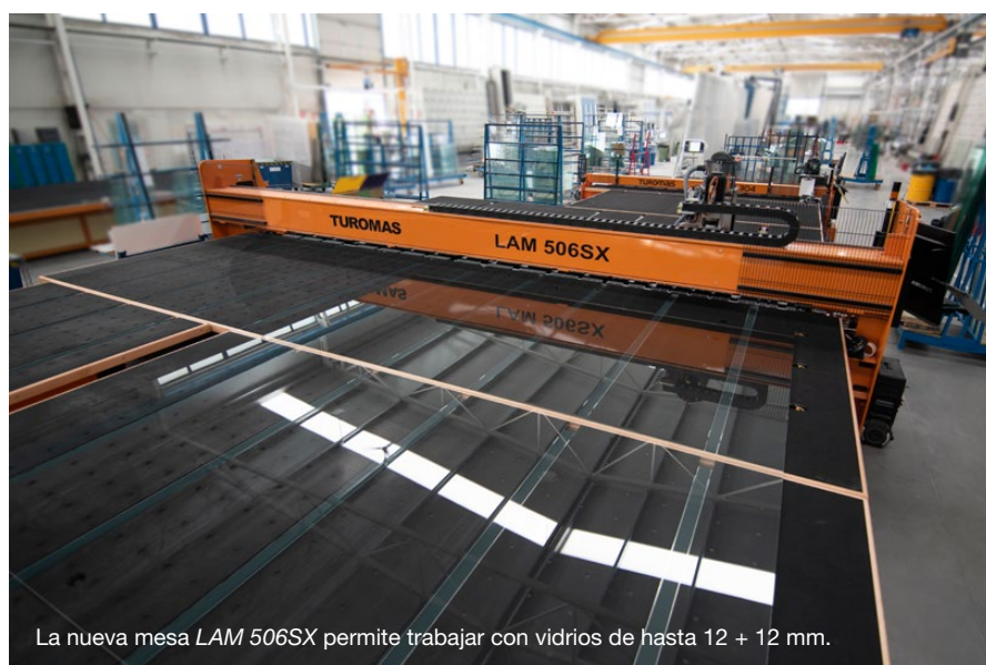
La nueva mesa LAM 506SX permite trabajar con vidrios de hasta 12 + 12 mm.

Acristalamientos Vinuesa nace como empresa familiar en 1967, momento en el que el vidrio no tenía la presencia que tiene hoy ni por supuesto tenía las características técnicas actuales. Es mi hermano mayor el que inicia el negocio al haber trabajado en una pequeña cristalería y este fue el motivo por el que le propuso a la familia el inicio de este proyecto. Yo por mi parte me incorporé cinco años después y desde el inicio me gustó mucho el negocio. Ese entusiasmo por el producto, junto con mis inquietudes, me llevaron a buscar nuevos horizontes más ambiciosos. Empecé a visitar ferias internacionales, en París, Alemania, etc., y vi que había maquinaria que yo no conocía. En ese momento tomé la decisión de cualificar a la